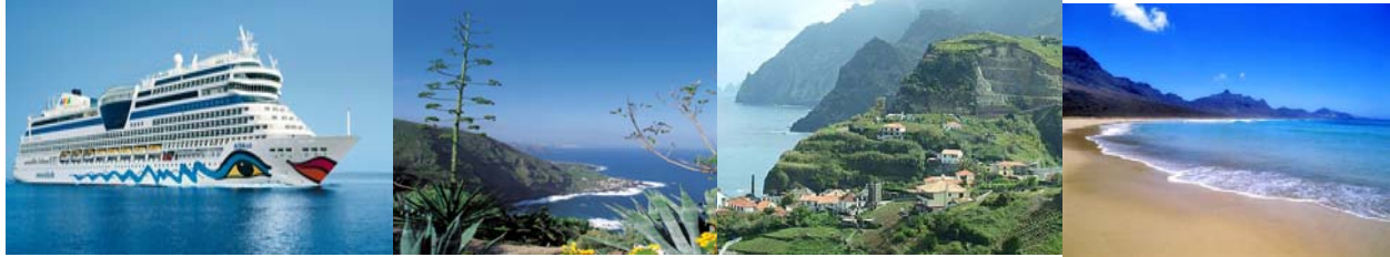
Teneriffa – Madeira – La Palma – Gran Canaria – Fuerteventura – Lanzarote – Teneriffa