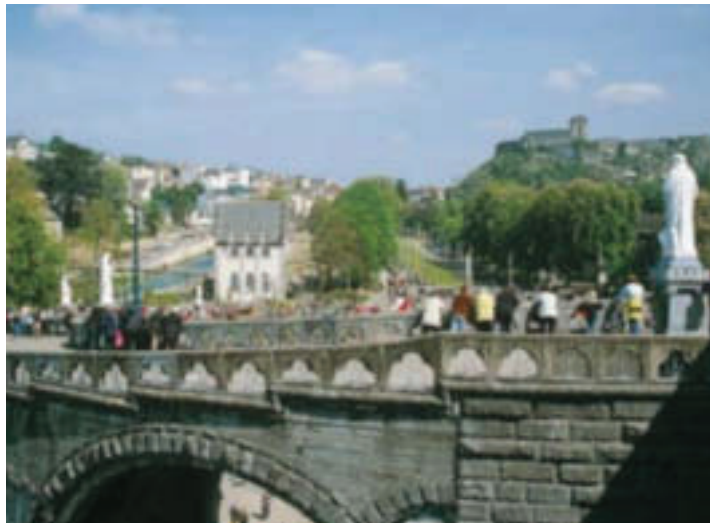
Brücke zur Basilika

1. Tag: Ars - Raum Avignon/Orange. Anreise über Freiburg - Mühlhausen vorbei an der alten Reichs- und Bischofsstadt Besançon - Chalon nach Ars. Hier besuchen Sie die Basilika mit dem Grab des heiligen Pfarrers von Ars. Beim Oktobertermin Messe in der unterirdischen Kirche von Ars. Weiterreise über Lyon - Rhönetal in den Raum Avignon/Orange. Abendessen und Übernachtung.