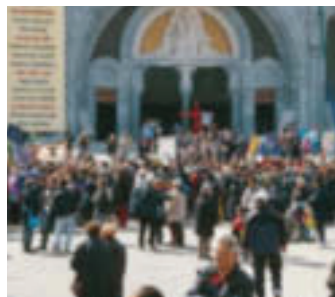
Platz vor der Basilika