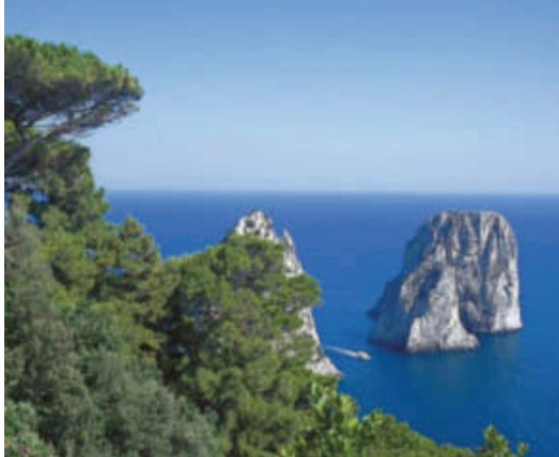
Halbinsel von Sorrent