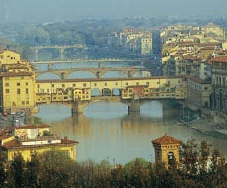
Stadt der Medici