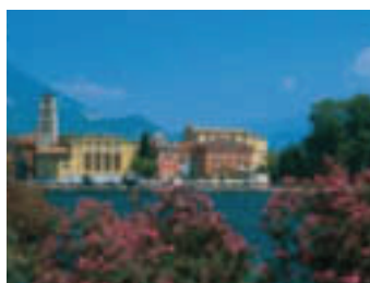
Riva del Garda

(bitte im Voraus reservieren): Benutzung von Sauna und Türkischem Bad (Code WELL) während des gesamten Aufenthaltes € 34,- Paket 1 (Code WEL1): 1 x Benützung von Sauna und Türkischem Bad, 1 x Massage (30 Minuten), 1 x Fußpflege € 59,- Paket 2 (Code WEL2): 1 x Benützung von Sauna und Türkischem Bad, 1 x Massage (30 Minuten), 1 x Gesichtsbildung € 65,-